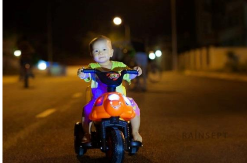
(Chích Bông đi tìm mẹ yêu lúc đêm về)