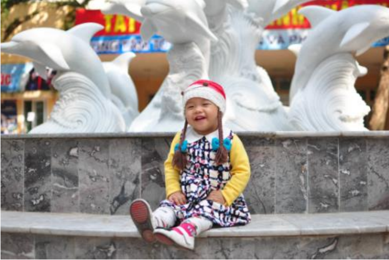
Tiêu chảy do Rotavirus dễ nhầm với ngộ độc thức ăn, cảm lạnh

Những ngày cuối năm Giáp Ngọ, Chích Bông bị tiêu chảy cấp do rotavirus. Ba mẹ đã cùng con chống chọi với dịch bệnh trong suốt một tuần dài.