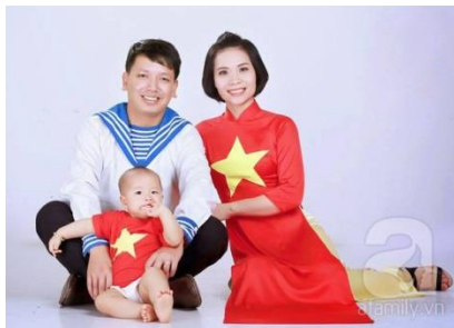
Bộ ảnh gia đình theo chủ đề biển đảo